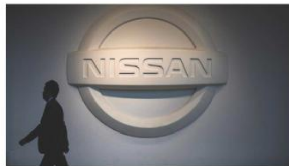
Sur l'exercice 2018-2019 clos fin mars, Nissan a écoulé 5,5 millions de véhicules.

Nissan n'avait pas connu de bénéfice net aussi bas depuis 2010-2011. À l'époque, il se remettait lentement de la crise financière mondiale et venait d'être touché par les effets industriels des terribles séismes et tsunamis de mars 2011. « Ces résultats ne sont pas une bonne nouvelle pour l'alliance » et