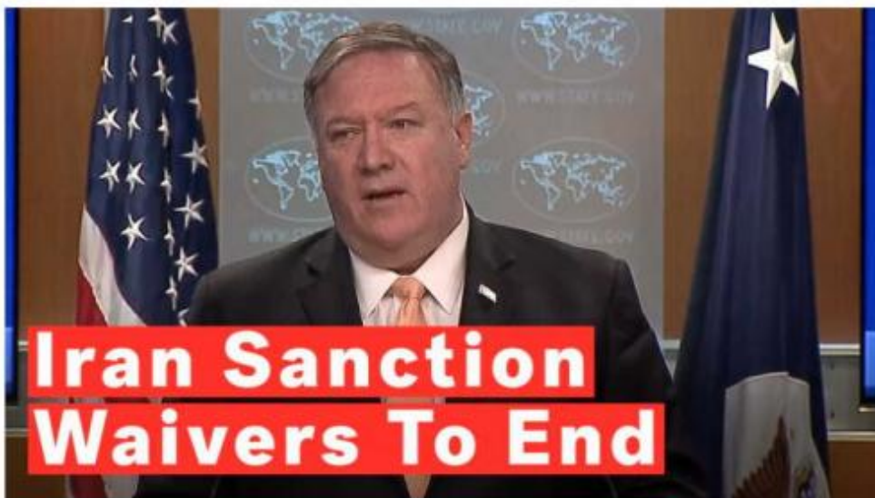
Secretary Mike Pompeo Announces End To Iran Sanction Waivers

The US, on its part, has deployed an aircraft carrier and bombers in the region saying there's threat from Iran against it and its allies. Meanwhile, last week's drone attack on oil tankers of Saudi Arabia and the UAE at Fujairah port intensified tensions in the region.