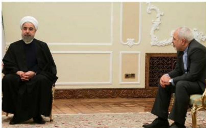
Hassan Rouhani and Javad Zarif