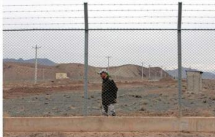
An Iranian soldier stands guard inside the Natanz uranium enrichment facility, 322km (200 miles) south of Iran's capital Tehran March 9, 2006.

Amid rising tension in the Middle East Iran has said it has increased the production rate of uranium four-fold. The Iranian statement is a direct challenge to the US, which has slapped more sanctions on the Shia state over its nuclear programme.