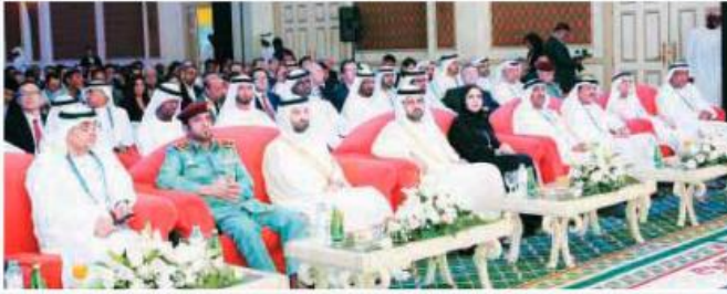
(اليمين: مشايخ سعيدي)