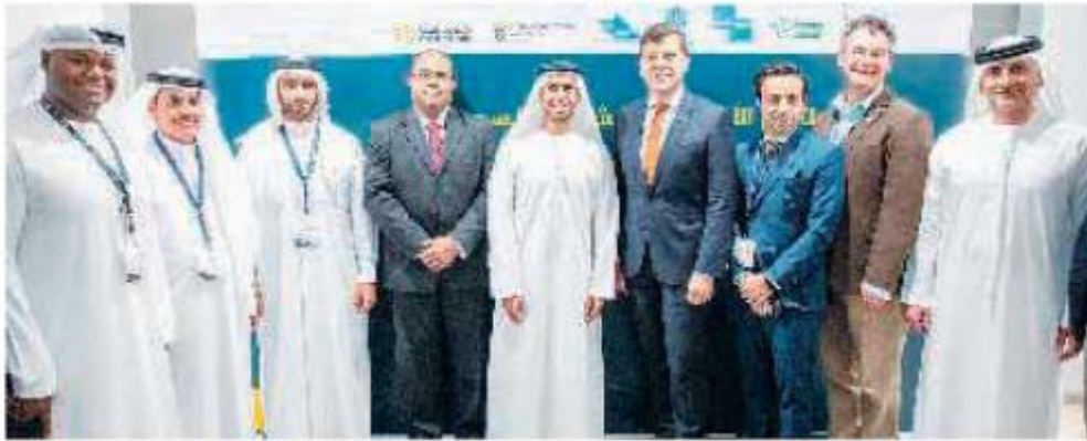
الشاركون في ملتقى أعمال الشارقة - السويد